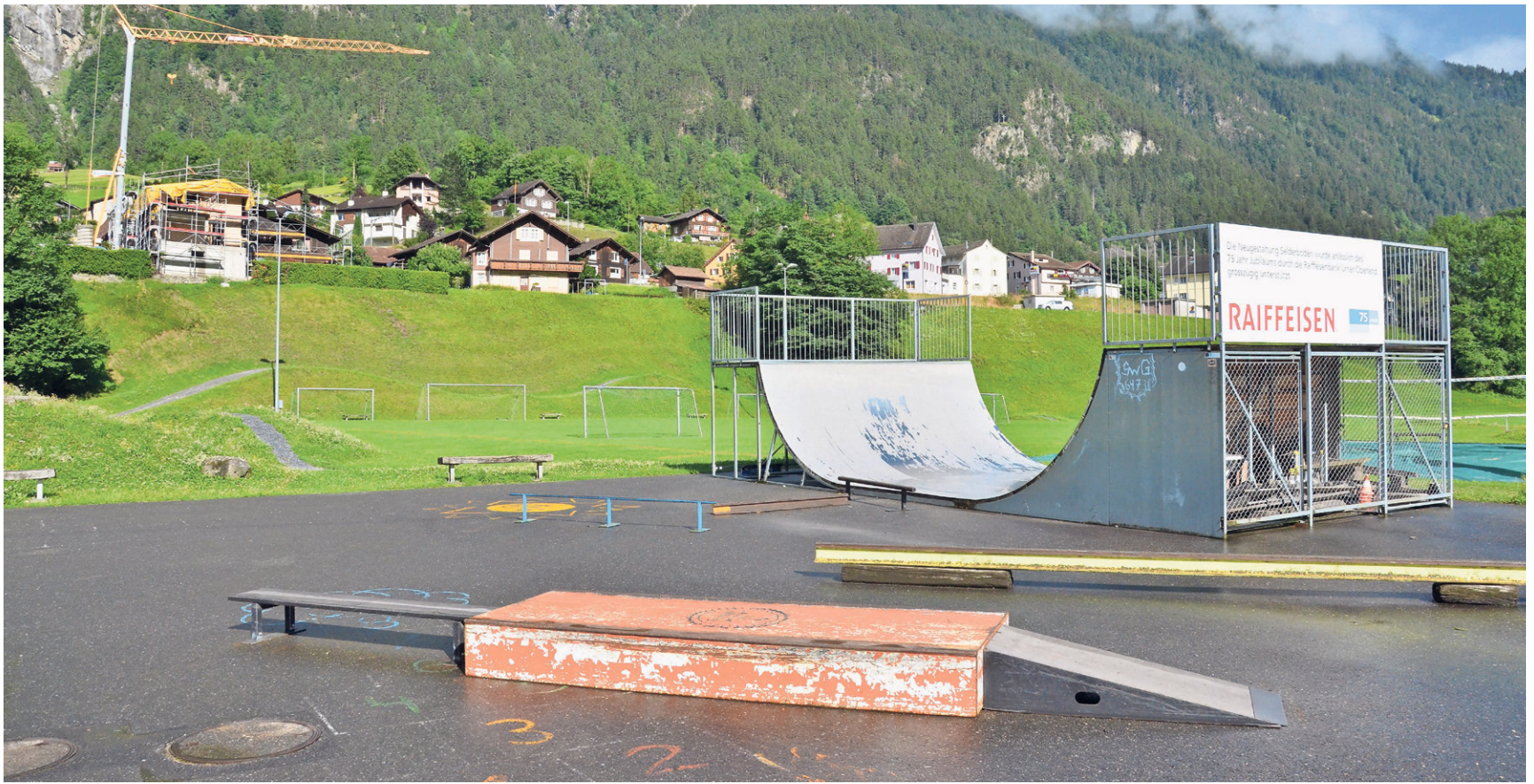
Die bestehende Freestyle-Anlage auf dem Selderboden ist veraltet und für Fortgeschrittene ungeeignet.

Eine solche Trainingsmöglichkeit möchte Freestyle Uri nun auf dem Selderboden realisieren. Der Silener Gemeinderat hat dem Verein auf der dortigen Sportanlage bereits eine Fläche für den Bau eines Skateparks zugesichert. «Die Gemeinde Silenen ist unserem Projekt gegenüber sehr positiv eingestellt und unterstützt uns auch tatkräftig», zeigt sich Damian Furrer erfreut. «Der Standort ist perfekt für unser Projekt.» Der 30-jährige Altdorfer weist auf das attraktive Freizeitangebot hin, das auf dem Selderboden schon besteht und von Biken über Fussball und Beachvolleyball bis hin zu Rollhockey reicht: «Ein Skatepark passt da also bestens rein. Zudem hat es öffentliche Toiletten, Parkplätze und nicht zuletzt auch eine Flutlichtanlage. Wir könnten somit auch am Abend trainieren.»